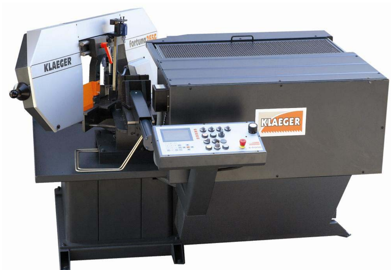
Fig. Máquina de sierra automática fortuna265G

La línea de producto de sierras de arco articulado fortuna ha sido desarrollada con la aportación de las experiencias de nuestros clientes. Las sierras fortuna son máquinas para un amplio campo de aplicación trabajando con gran fiabilidad y muy buen rendimiento de corte. El nombre Klaeger fortuna es la prueba de muchas décadas de experiencia en la construcción de sierras, desde 1928.